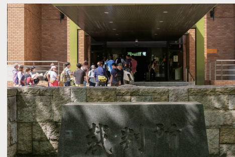
若者気候訴訟の傍聴のため裁判所入口に並ぶ人たち

若者気候訴訟の傍聴には毎回、名古屋地裁の大法廷の定員(約100名)を超える希望者が集まり、満席が続いています。傍聴券を求める人の長い列が、この訴訟への関心の高さを示しています。