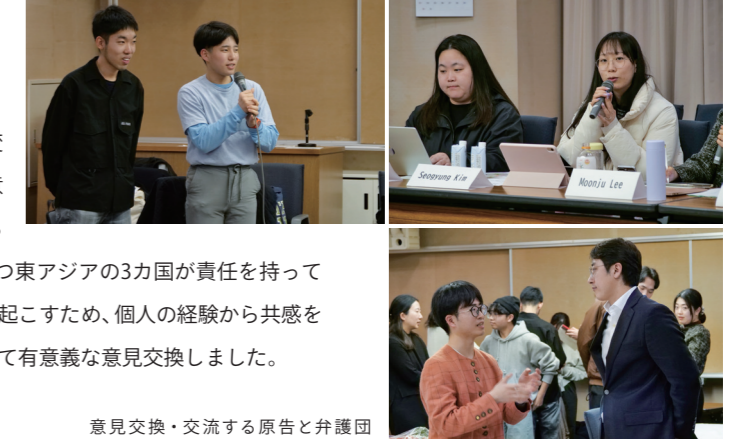
意見交換・交流する原告と弁護団

東アジアの気候訴訟に関する国際シンポジウム「気候訴訟で社会を変える—動き出した東アジアの若者たち」が開催されました。前日の意見交換会を含む2日間にわたり、日本、韓国、台湾の気候訴訟に参加する同世代の若者や弁護団が交流を深めました。民主主義と法治主義を持つ東アジアの3カ国が責任を持って気候変動に取り組む重要性を確認したほか、訴訟を通じて社会に変化を起こすため、個人の経験から共感を広げる方法など、多くの人を巻き込むための具体的な取り組み例について有意義な意見交換しました。