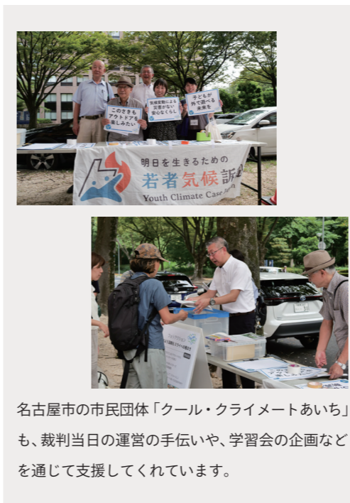
名古屋市の市民団体「クール・クライメイトあいち」も、裁判当日の運営の手伝いや、学習会の企画などを通じて支援してくれています。